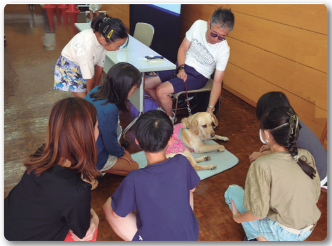
▲視覚障がい者(盲導犬)のことを理解する教室 (8月5日)