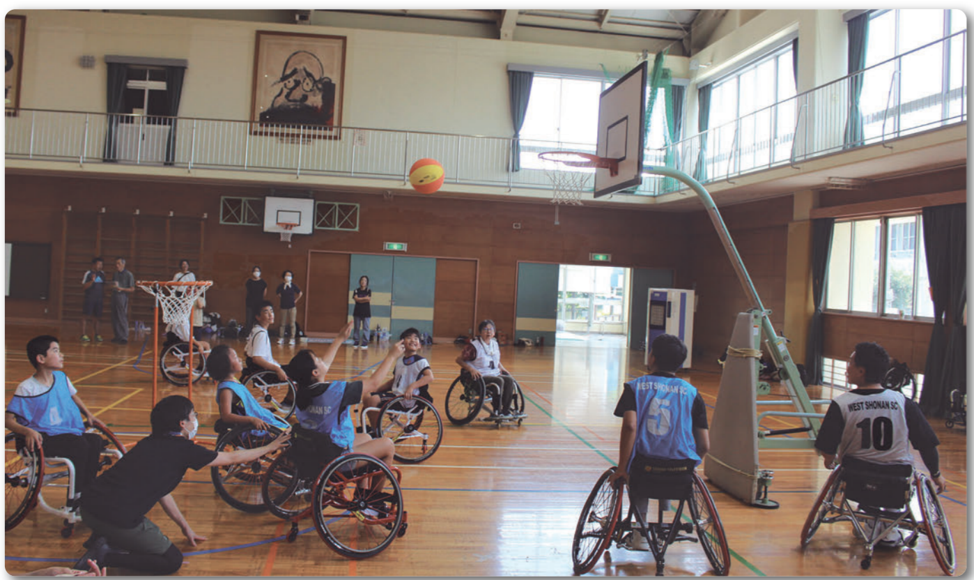
▲車いすバスケットボール体験教室 (8月11日)