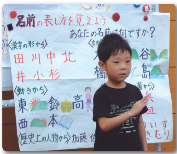
▲親子手話体験教室 (8月7日)